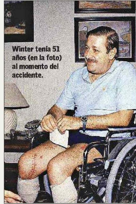
Winter tenía 51 años (en la foto) al momento del accidente.

“El accidente marcó mi forma de mirar la vida, estoy agradecido y gozo cada día. Esto me da fuerza para tratar de trabajar mucho más en una relación que debiera ser mucho mejor. El futuro de Chile está ligado al de sus vecinos; mi visión es intentar por todos los medios posibles arreglar esta relación”.