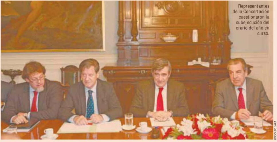
Representantes de la Concertación cuestionaron la subejecución del erario del año en curso.