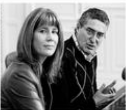
En la sala del Senado en Santiago, Sofía Ballester y Piñera con sus esposas.

En una visita a la localidad donde se iba a instalar la central termoeléctrica, dijo que con esta cumple su promesa de candidato.